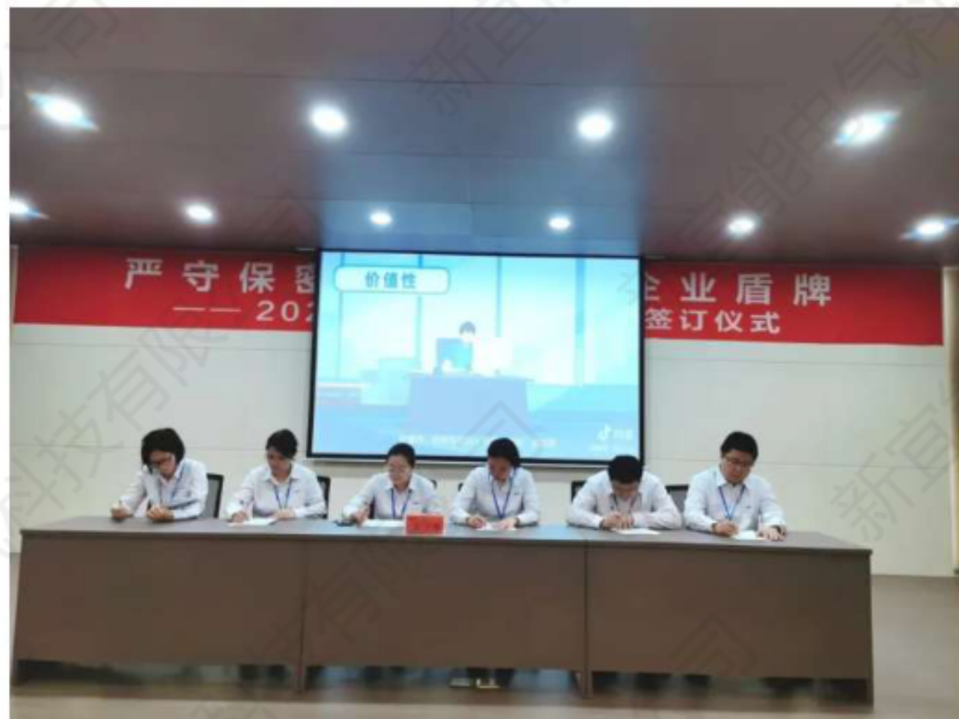
庄重承诺 筑牢保密长城

保密工作是企业生存发展的生命线，员工们分批签署保密协议，深刻领悟遵守保密责任的重要性。他们将以本次活动为契机，从思想上重视、行动上落实，将保密要求融入日常工作，共同维护公司核心竞争力。